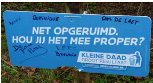
Deze gehandtekende borden zie je overal waar acties plaats hebben gevonden.

Om aan te tonen dat zwerfvuil niet ongestraft blijft, zal in de week van 18-24 september in heel Vlaanderen de Week van de Handhaving doorgaan.