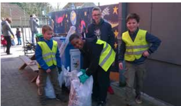
Bij VBS De Kreek in Kieldrecht zat de sfeer er goed in.