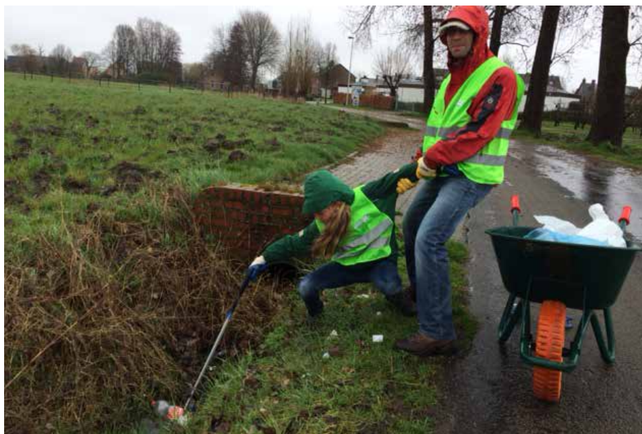
Enkele bewoners uit de Neerstraat Zwijndrecht moesten lenig zijn.

Bekijk foto's op p. 2 en op http://www.ibogem.be/blog/zwerfvuillactie-2017-fotoalbum/