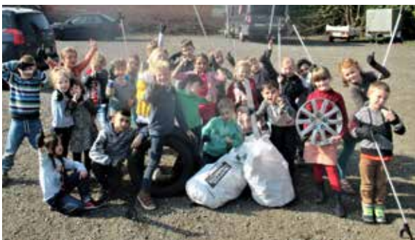
De leerlingen van Sint-Jan Berchmans Rupelmonde vonden de gekste dingen.